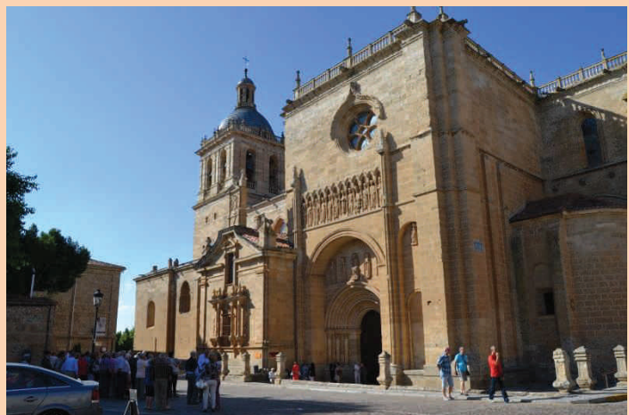
S. I. Catedral de Ciudad Rodrigo

Da comienzo el Curso en la tarde del día 29 con el recibimiento y calurosa acogida