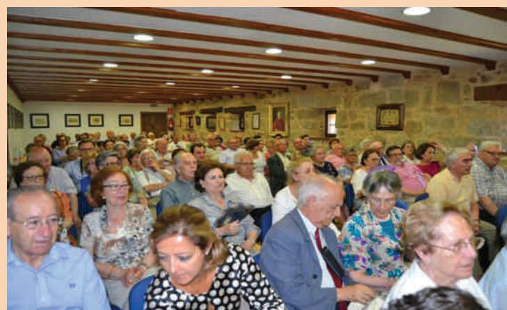
Vista del Salon “Obispo Mazarrasa” , en el Palacio Episcopal, donde se celebraron las conferencias

diversos actos tanto religiosos como sociales, a las visitas y a la Vigilia de Espigas, celebrada en la S. I. Catedral, con una procesión por la parte antigua de la Ciudad, hasta las murallas históricas, que ha dejado un recuerdo inolvidable en todos los asistentes.