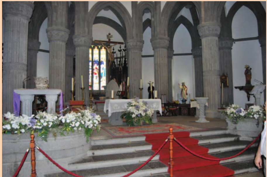
Iglesia de San Juan Bautista de Arucas

Nos desplazamos luego a Arucas, pueblo muy conocido por su fábrica de ron, una de las más grandes de Europa, y cuyo monumento más importante es el precioso templo de San Juan Bautista, conocido popularmente como la