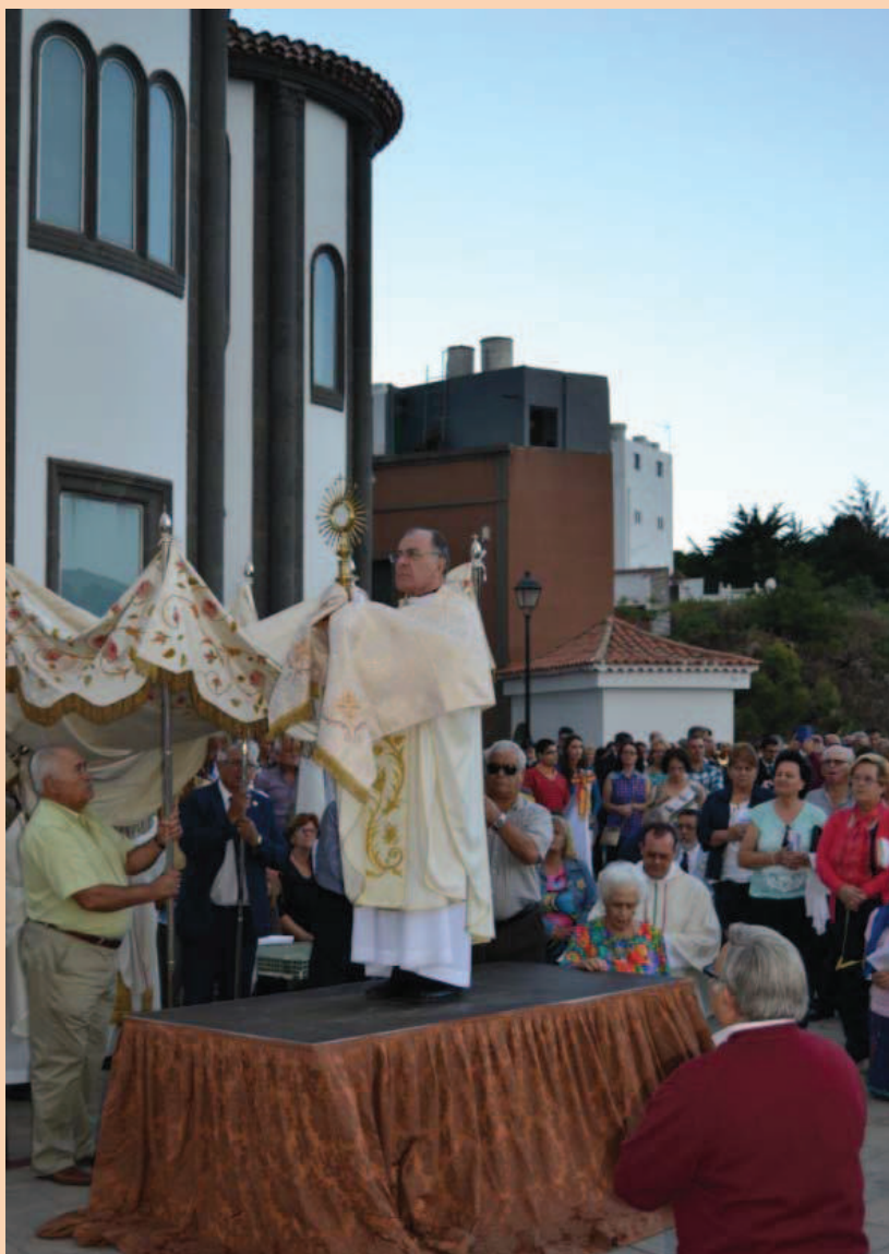
Momento de la bendición por el Sr. Obispo en la procesión de la Vigilia de Espigas